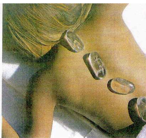
La Cabine de Valérie