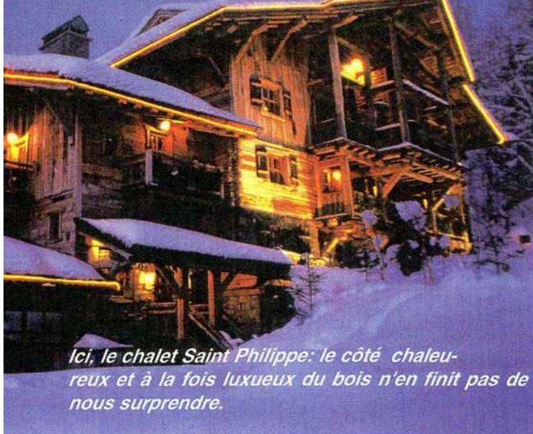
Ici, le chalet Saint Philippe: le côté chaleureux et à la fois luxueux du bois n'en finit pas de nous surprendre.