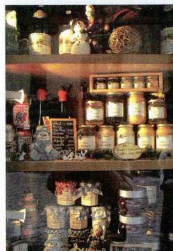
Les produits traditionnels du terroir sont omniprésents à tous les coins de rues et donnent aux vitrines tout leur charme et leur raffinement.