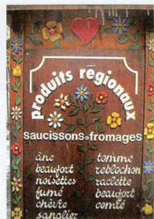
Peintures sur bois: toute l'âme de la Haute Savoie...