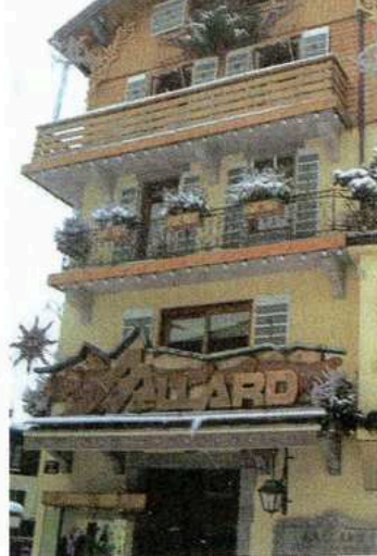
Impossible de venir à Megève sans passer par la boutique Allard qui a créé le premier fuseau de ski.